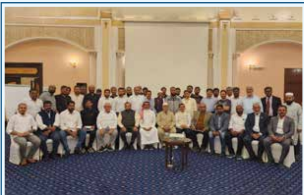
Attendees in Riyadh Meeting