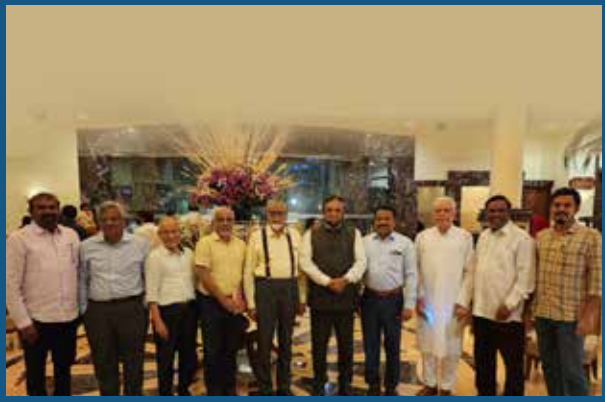
Along with Advisory Committee Members