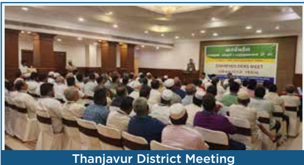
Thanjavur District Meeting