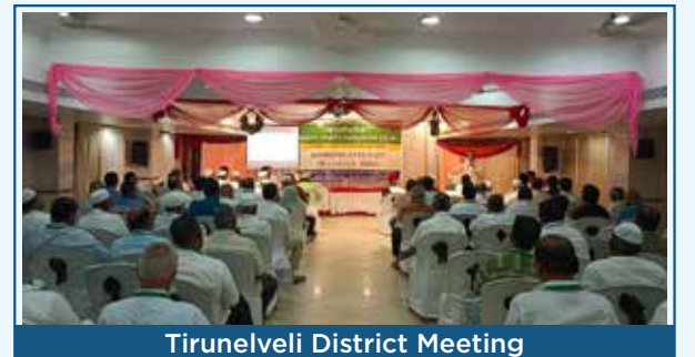
Tirunelveli District Meeting