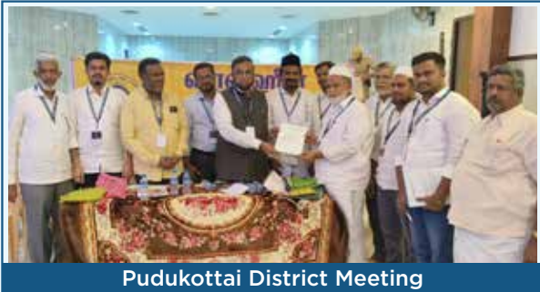
Pudukottai District Meeting