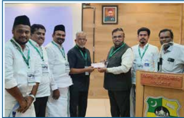
Trichy Jamal Mohamed College Meeting