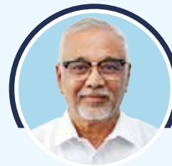
Justice G.M. Akbar Ali Former Judge, High Court of Madras