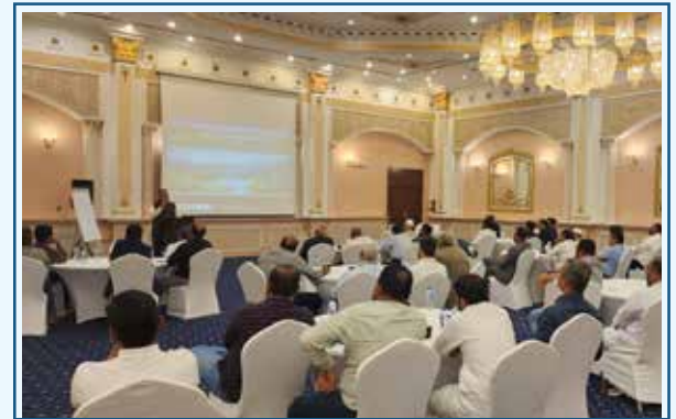
Riyadh, Saudi Arabia Meeting