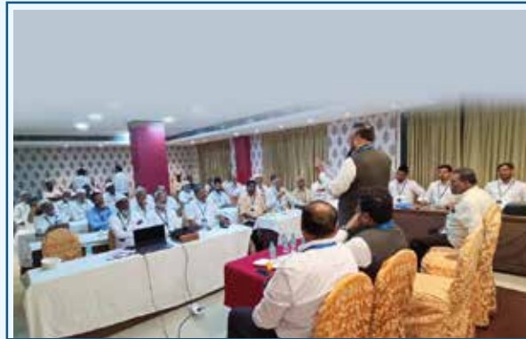
Salem District Meeting