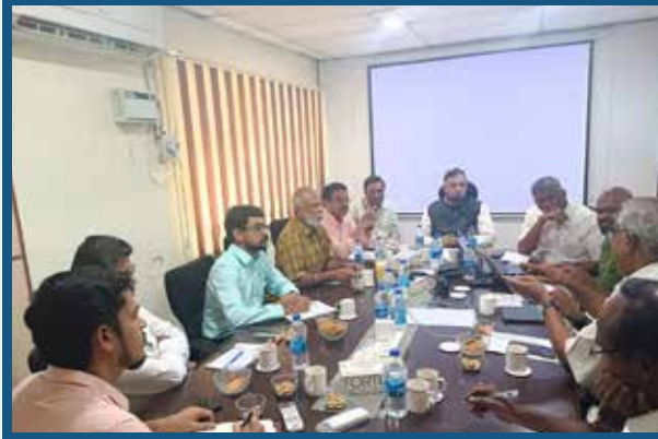
Discussion with Financial Experts