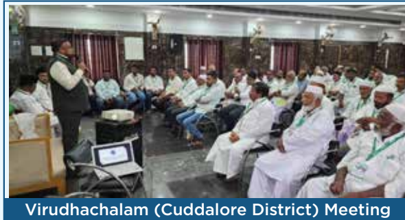
Virudhachalam (Cuddalore District) Meeting