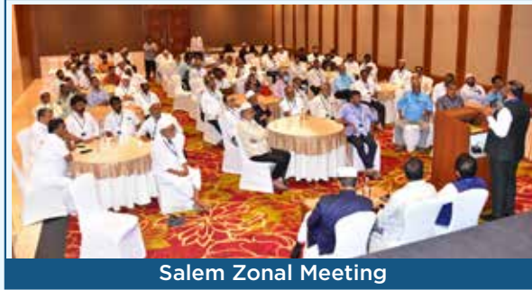
Salem Zonal Meeting