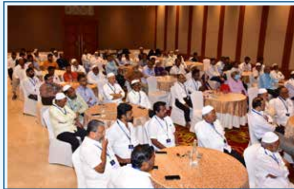
Coimbatore District Meeting