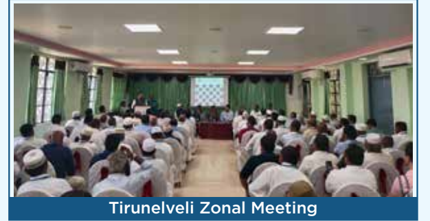
Tirunelveli Zonal Meeting