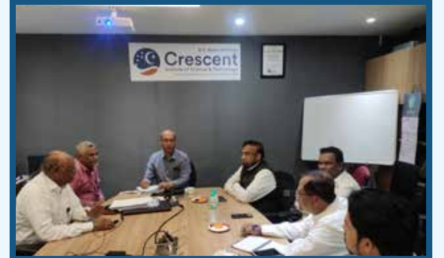
Discussion in B.S. Abdur Rahman University