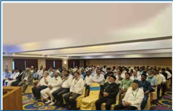
Chennai District Meeting