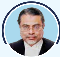
Justice F.M. Ibrahim Kalifulla Former Judge, Supreme Court of India