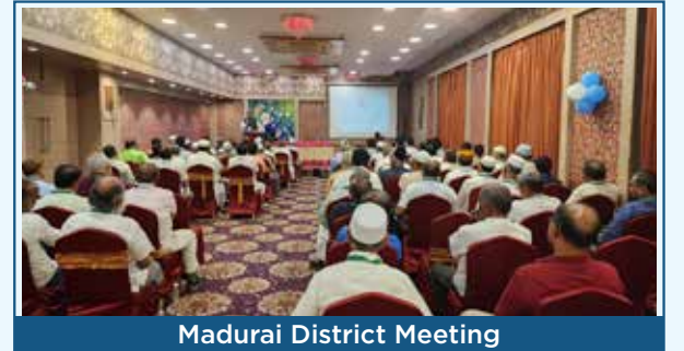
Madurai District Meeting