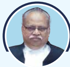
Justice K.N. Basha Former Judge, High Court of Madras