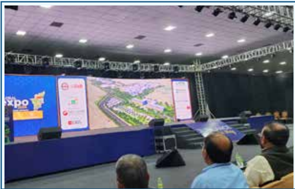
Coimbatore Global Expo 2024 Meeting