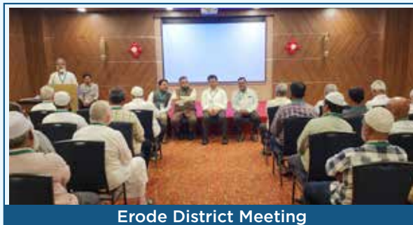
Erode District Meeting