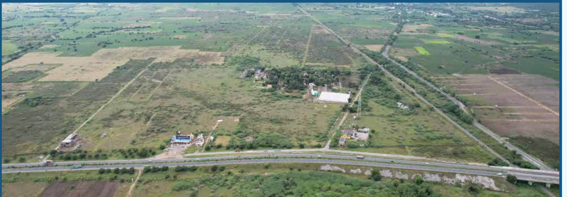
Aerial Site View (11.5850° N, 79.1568° E)